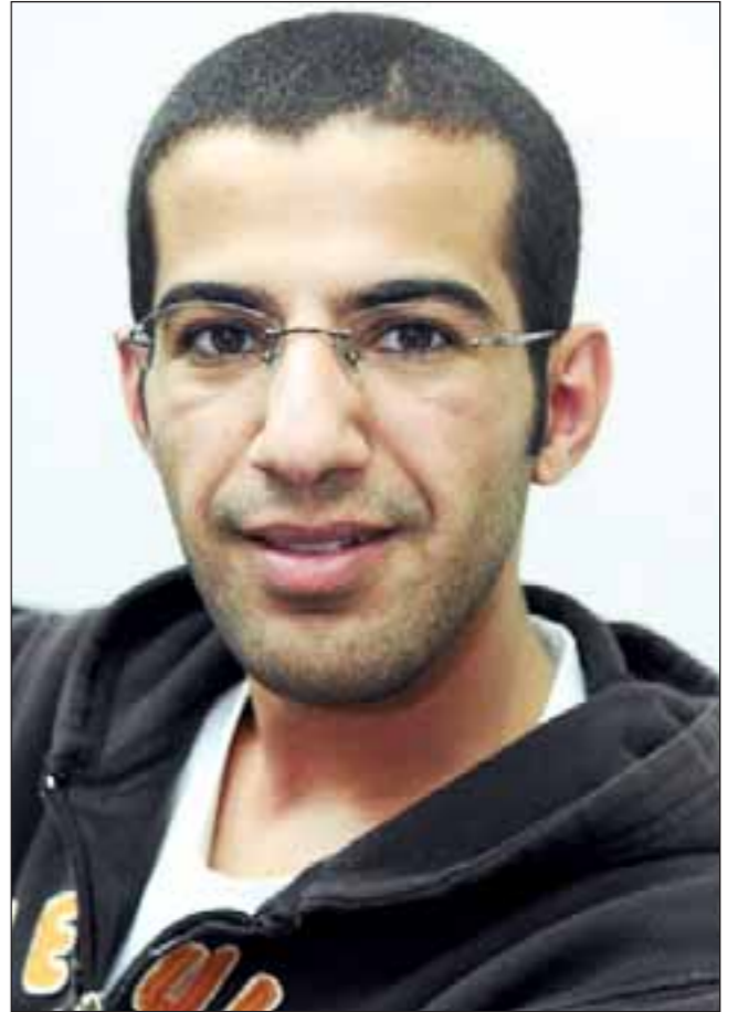
المخرج علي العلي