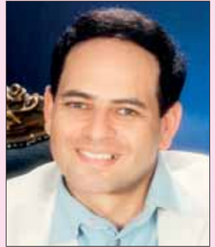
ممدوح عبد العليم

المسلسل يتم تصويره حاليا للعرض في شهر رمضان ويأمل ممدوح عبد العليم ان يلقي هذا العمل استحسان المشاهدين، مؤكدا ان عرض الاعمال التلفزيونية على بعض الفضائيات دون عرضها على التلفزيون المصري يظلم الفنان ويظلم هذه الاعمال، وعبر عن سعادته بدور آدم مضيفا ان اسم الشخصية يعبر عن مضمون العمل فهو انسان يقلب على طبيعته العمل الخيري ويتعرض للظلم أكثر من مرة. يشارك في البطولة سماح أنور التي سبق ان شاركته مسلسلها الأخير «الحب موتا» ويشارك فيه ايضا سلوى خطاب، زيزي مصطفى، غادة ابراهيم، عنبر، ريم البارودي، داليا ابراهيم، تأليف مجدي صابر، اخراج خيرى بشارة.