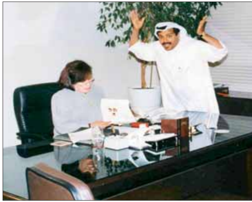
العقل مع القديرة حياة الفهد في مشهد من مسلسل «الطير والعاصفة»