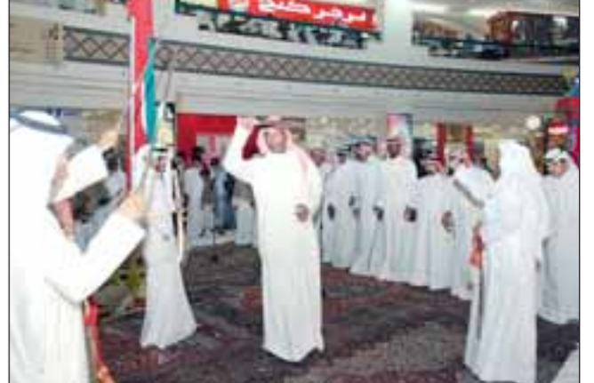
من عروض الفرقة في مجمع الخيمة مول