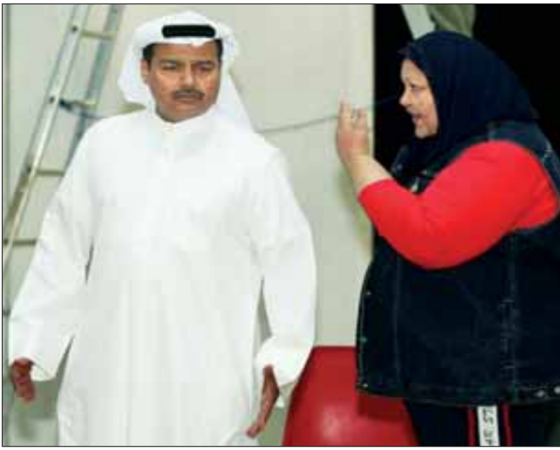
مع انتصار الشراح في المسرحية الكوميدية «زواج سعادة الوزيرة»