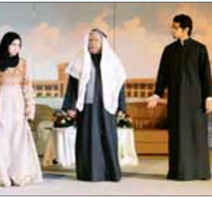
.. في أحد أعماله المسرحية

سبحر الطفل اليوم من غير نص وهذا شيء حزن وسبب يبعثني على المسرح لكنني متفائل بمجهود مؤسس مسرح الطفل الفنان القديم منصور المنصور حالياً مع شركة الرواد الأوائل التي تسعى لإرجاع زمان السنين وبغيره من المسرحيات الناجحة.