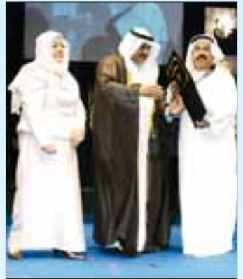
.. ومع انتصار الشراخ