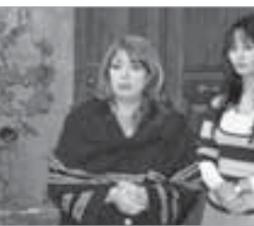
فاديا خطاب في أحد أعمالها الدرامية

وقد اختار بعضها منها. هي كطرفة وكثيرة جدا، وعلى سبيل المثال معظم الأدوار المهمة في الأعمال والمسلسلات السورية هي وقف على الرجل، وبالمقابل هناك إهمال كبير تجاه الأدوار النسائية، في حين تغضب مجتمعاتنا بالتغيرات الاجتماعية الكبيرة التي تخص المرأة في عصرنا الحديث ولا أحد يتعرض لها، طموح أن أجسد دور القاضية مثلا التي قد تتعرض للضرب والإهانة لأنها حكمت لفلان ضد فلان، وما يستتبع ذلك من حالات نفسية قد تعجزها هذه القضايا، أيضا أتمنى ان العبر دور الوزيرة والمناشيل التي واجهتها في حياتها العامة ومع أسرته، الزواج الأول، الأقارب، أي الوجه الآخر للمسدة، كذلك الطبيعة والمحامية وعشرات الأخرى من المناسج الغريبة تماما في الدراما التلفزيونية السورية.