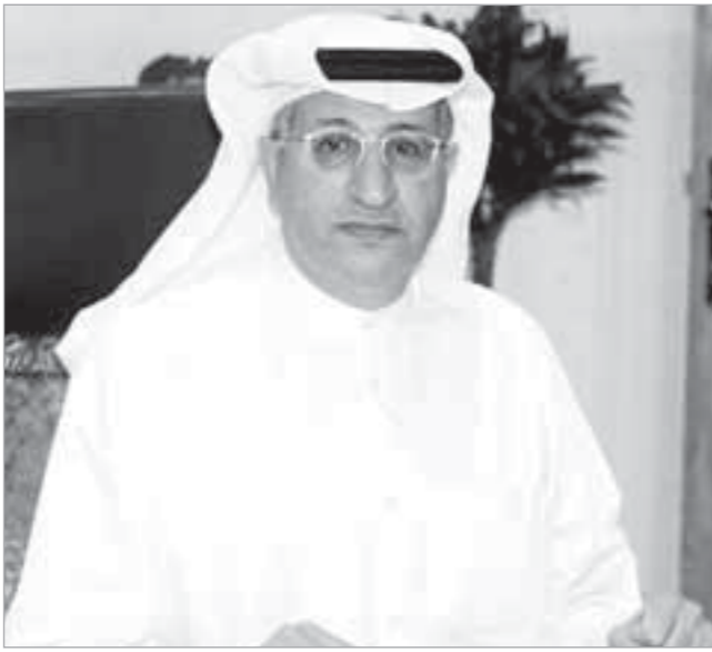
مدير عام القناة الأولى علي الرئيس

يذكر أن صابرين تعرضت لهجوم شديد على ضوء قرارها بارتداء شعر مستعار فوق الحجاب من قبل أساتذة الأزهر، خاصة الدكتور أمينة نصير عميدة كلية الدراسات الإسلامية والعربية في جامعة الأزهر، والتي اعتبرت مسألة الاستعاضة بغير الشعر الطبيعي نوعاً من أنواع التحايل على الله عز وجل.