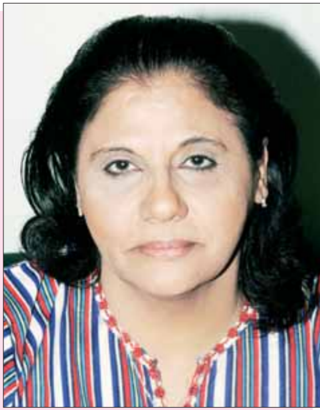
الفنانة القديرة اسمهان توفيق

يرطلب النص الدرامي التراجيدي حزين واذا قلت له شريك بنص كوميدى يخلى الناس تضحك يقول الناس تبني شئي بخليها تبكي وانا من وجهة نظري انها ظاهرة لأن كل المؤلفين يكتبون بهذا الاتجاه، والسبب ان المنتجين بيون جدي وعلى مستوى الشخصي لما اكتب اي نص تراجيدي ونص كوميدى الفنى النص التراجيدي المرغوب اكثر عند المنتجين.