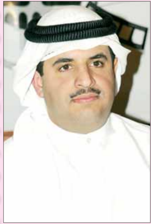
الشيخ دعيج الخليفة