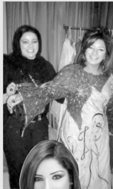
مرام في مشهد من مسلسل الأصيل

كيف تصفين تجربة غناءك أغنية من كلمات والحنان وبشار الشطي؟ هي تجربة جديدة واستطاع بشار أن يقدم فيها «في خلو» عبر