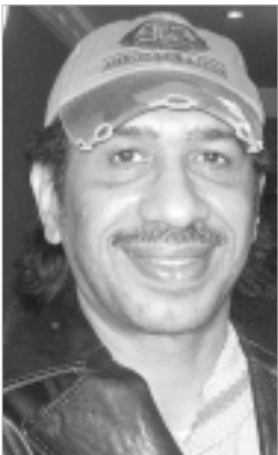
الملحن السعودي ناصر الصالح

الملحن ناصر الصالح عبر في لقاء عن اعجابيه بصوت النجمة يارا لأنها من الأصوات التي لفت الانتباه إليها بسرعة رغم مسوارها الصغير في الغناء.