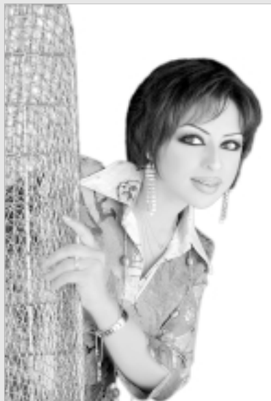
الفنانة هند البلوشي