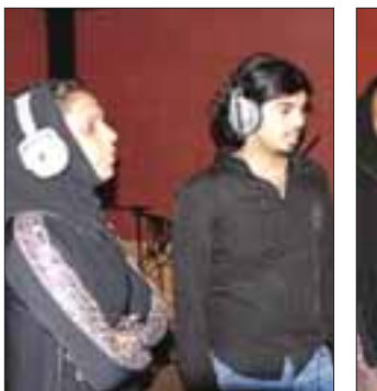
الكعبى والحان في استديو التسجيل