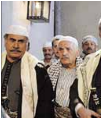
مشهد من «باب الحارة»

تدعو إلى الشفقة والرحمن معاً، فالأفراء على الحارة الشامية قد بلغ أوجه في مسلسل لم يجد فيها غير الحلق ورائع الخضرة ولأن عمه والرتي تاري، كما لم يجد سوى المرأة القهورة والثرثرة وربة المنزل، وتساءلت الصحفية التي ينتقد بها المسلسل. من ناحية أخرى أجمع العديد من النقاد على تراجع مستوى «بلاط السيدة أم عصام».