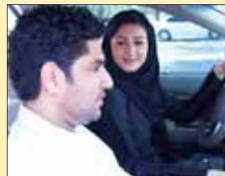
مشهد من مسلسل «أزهار مريم».

مسلسل اجتماعي يناقش تراث الأسرة ويسلط الضوء على عدد من القضايا الاجتماعية التي يعاني منها المجتمع الخليجي والعربي. المسلسل من بطولة هيفاء حسين، لمياء طارق، ناصر محمد ومن اخراج مصطفى رشيد ويبدأ عبر قناة «سما دبي».