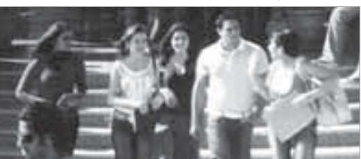
مشهد من الفيلم

اقصاه عن عمله عند عودتها الى مصر لكن يتفانى المخرج الى اجواء هوليودية رائعة، حيث يتم حفظ شغفة وحموية وزراء، وهنا يبدأ تيمور والصراع مع الكوميدي وعملها انه مازال على عهده القديم وهو الحفاظ عليها من كل مكروه وهنا تتنازل شفيقة عن كبريائها وتضرب بين حمانته لها كزوج افضل من كمارس شخصي لوزيرة ويتبنى الفيلم على ما بدأ عليه، وهو الشجار بينهما في محاولة الغرض الرائي. العمل يكامله لم يدخل من دلال من حبيبتين، ويتجهد تيمور بان يحافظ على شفيقة من كل خطر، وكانه وع يد لنا ليرا ان ما سيحدث في نهاية الفيلم، وذلك تخصي الآرام ويتخبرج تيمور ويعيد ضابطا في الجراسات الخاصة بالصاحبة للوزراء وكذلك تعمل شفيقة بالجامعة وتصل الى كتيور، ورغم ان الأحداث كانت تتوالى لساح شفيقة إلا ان تيمورا لم يترك لها المجال على الغارب وإنما ظل كما هو على غيرته عليها وفي رحلة في الأخيرة في أحداث الفيلم التي تمثل شفيقة التنازل عن الوزارة من أجل تيمور الذي يطلب منها