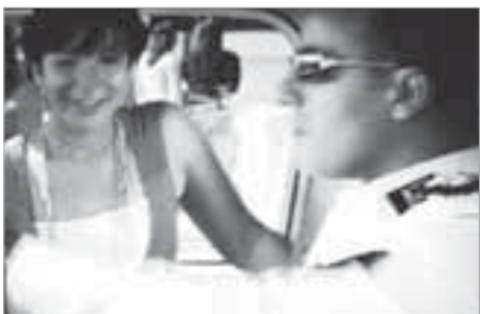
لقطة من فيلم 'تيمور وشفيقة'