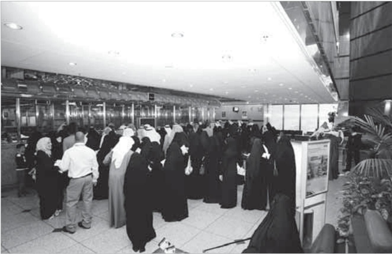
ارتفاع القروض المجمعة بفضل زيادة عمليات الاستحواذ الخليجية

أعداد: زكي عثمان ارتفعت القروض المجمعة في منطقة الشرق الأوسط بنسبة 65% في عام 2007 إلى مستوى قياسي جديد بلغ 151 مليار دولار إذ خالف الإقراض الإقليمي الاتجاه العام في العالم المتأثر بأزمة الائتمان العالمية.