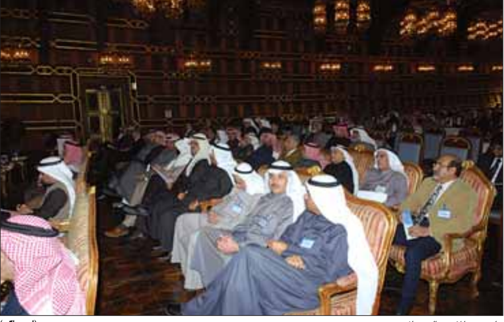
جانبا من المؤتمر الصحافي

ان اولوية عمل المؤسسة بعد الخصخصة هي التوجه نحو شراء طائرات حديثة تدعم بها الاسطول.