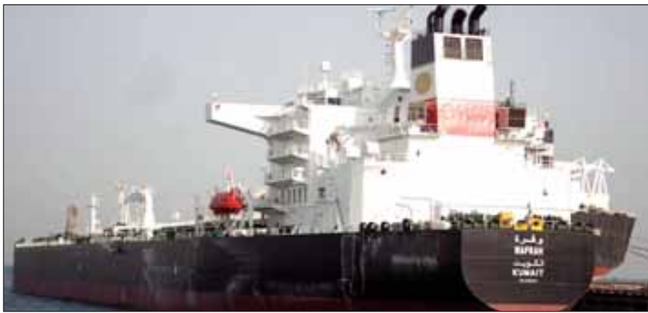
ناقلة وقرعة الجديدة التي دخلت الخدمة مؤخرا ضمن خطة تحديث الأسطول

معيئة سيتم اختيارها لبناء السفن الست لتلك المرحلة. وكشفت المصادر عن نية الشركة للتخلص من 3 ناقلات أحادية البدن، هي الصامدون، وربة وكيفان، مشيرة إلى أن قيمة الناقلات الصامدون السوقية ما بين 30 و40 مليون دولار. ونفت المصادر أن تكون هناك نية من قبل الشركة لتأجير ناقلاتها لجهات أخرى تستخدم مؤسسة البترول، مؤكدة أن الشركة تستخدم تلك الناقلات للعمل لدى المؤسسة التي قامت بالتخطيط لبناء وتحديث الاسطول الحالي بما يتوافق مع احتياجاتها المستقبلية.