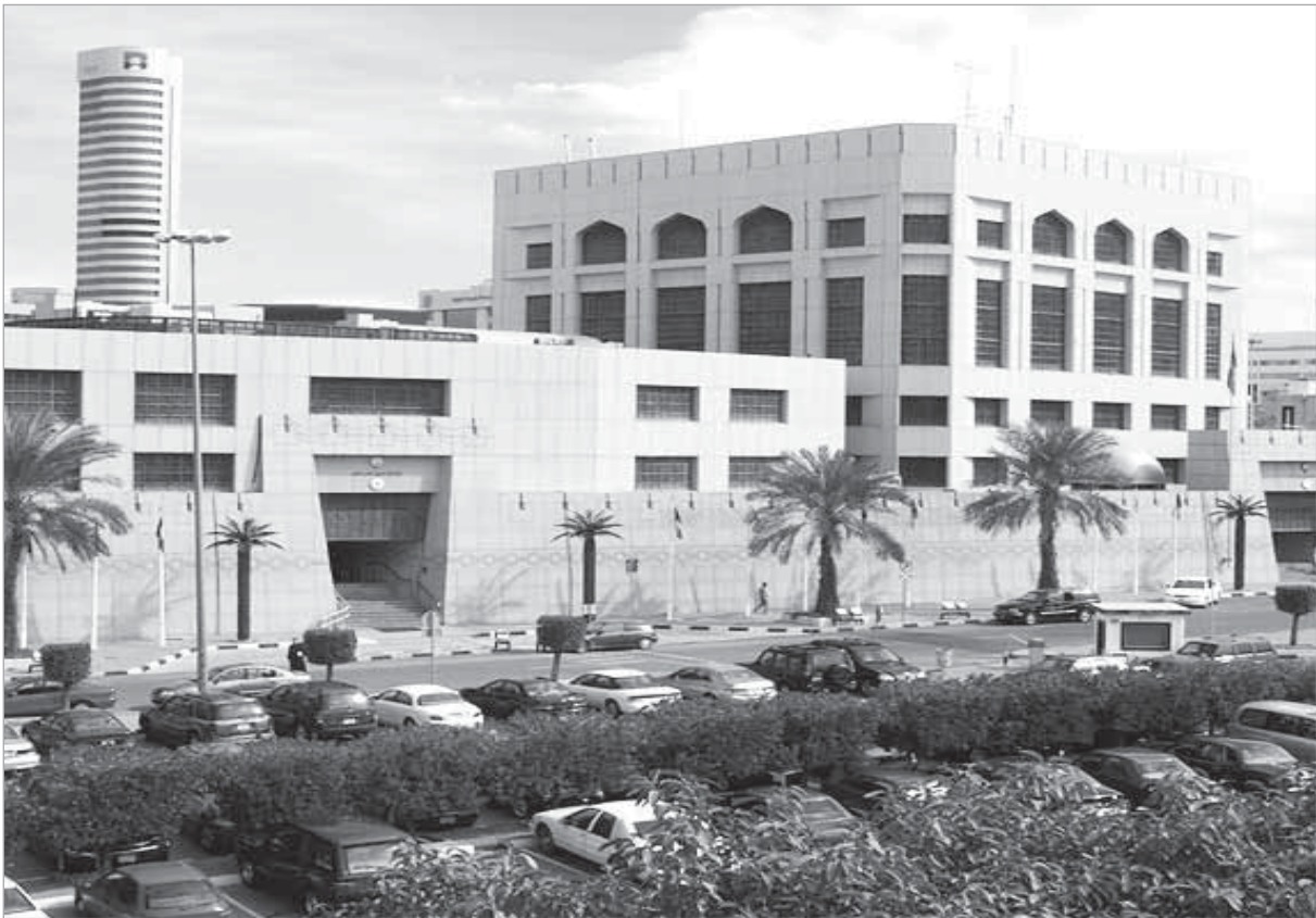
المركزي يواصل ضبط قيمة الدينار مقابل الدولار

رويترز: رفع البنك المركزي قيمة الدينار مقابل الدولار امس لاعلى مستوى منذ نحو 20 عاما مع انخفاض الدولار مقابل اليورو الاوروبي والسين الياباني بفعل مخاوف من أن يدفع ضعف أرباح الشركات الاميركية الاقتصاد نحو الكساد.