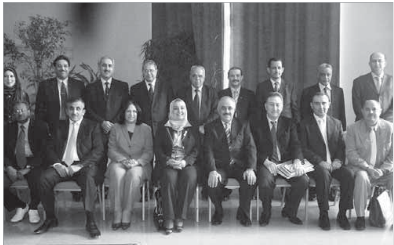
الرئيس مصطفى الشمالي متوسلاً أعضاء مجلس أمناء المعهد العربي للتخطيط

من هذه الأنشطة، خصوصاً انه ينفذ برامج وشهادات تخصصية للكوادر العليا في الدول العربية «إضافة إلى برامج لجهات معنية في إطار نشاطه الإستشاري». وقال أن مجموع الذين اجتازوا الأنشطة التدريبية من العالم العربي من عام 1966 إلى عام 2007 يفوق 11 ألف شخص تخرجوا عبر دورات المعهد التي ساهمت في دعم التنمية البشرية في الوطن العربي. وأوضح الغزالي أن المعهد ينفذ من خلال خبرائه مع خبراء من خارجه بحثاً ودراسات في مجالات اقتصادية وتنموية مختلفة تهتم الدول العربية بشكل مباشر وإن النشاط البحثي