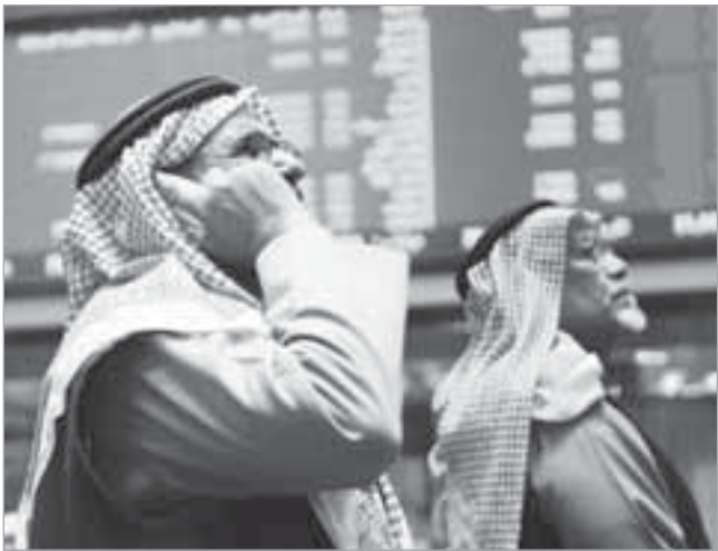
متداولون يتابعون أداء البورصة

ليسجل بذلك رقماً تاريخياً ما انعكس على مجريات أداء البورصة ويتوقع أن يستمر بقية أيام الأسبوعين الجاري والمقبل. وتابع الشخص أنه لآقتاً للمظهر أيضاً عمليات الشراء المحمومة من جانب محافظ داخلية لشركات مدرجة حيث قامت بشراء أسهم متفقا لصالح بنوك غربية ما يدل أيضاً على أن عوامل الدفع المتمثلة في ارتفاع أسعار النفط وإقرار بعض القوانين الداعمة قد أسهمت في عودة الثقة بين المستثمرين الأجانب. وأكد أن البورصة تعيش حالياً عصراً من أزهى عصورها إذ أن التداولات تشهّر إلى انتعاشية بمهنية من جانب المتداولين الذين أصبحوا يدركون تماماً الأسمه ذات الأداء التشغيلي الجيد ويعرضون عن الأسهم الرخيصة أو المضاربة. وكان مؤشر سوق الكويت لسلاؤراق المالية قد ارتفع اليوم بواقع 100.1 نقطة مسجلاً أعلى مستوياته التاريخية ببلوغه مستوى 13359.2 نقطة.