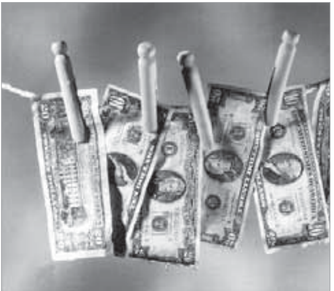
نشاط ملحوظ خليجيا لمكافحة عمليات غسل الأموال

عضوية مجموعة Egmont. كما أقرت الحكومة السعودية قانونا لمكافحة تبييض الأموال، لتضييق الخناق على الدعم المحلي للمتشددين، ويقضي بأن تتحقق المؤسسات المالية من هوية الراغب في تنفيذ صفقة نقدية او تجارية، وأن تحتفظ بسجلات عملياتها مدة عشر سنوات. كما تعد المملكة الآن استراتيجية وطنية لمكافحة المخدرات وصوغ تشريعات بهذا الشأن. وكان مجلس الشورى قبل صدور القاضون الجديد وضع عقوبات مشددة لرتكبي جرائم تبييض الأموال من خلال مؤسسات خيرية او اصلاحية، او القيام بذلك عبر عصابات منظمة، او في حال استخدام العنف او الأسلحة، او تبييض