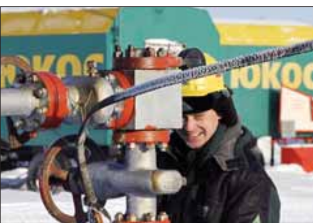
الدرول النفطية مستمرة في البحث عن النفط رغم أبحاث الطاقة البديلة

في اندونيسيا وزيادة انبعاثات الكربون وتهدد أنواعا معرضة للانقراض بينما تقول منظمة الأمم المتحدة للأغذية والزراعة إن مزارع الوقود الحيوي على مستوى العالم تنافس على أراض مخصصة لزراعة محاصيل غذائية مما يرفع من أسعار المواد الغذائية. كما أظهرت الدراسات أن الوقود الحيوي يؤدي لزيادة قليلة في انبعاثات أحد غازات الاحتباس الحراري وهو أكسيد النيتروز الذي يعرف باسم الغاز الضاحك. ويقول المدير التنفيذي لمنظمة لا تسعير للمرج تعرف باسم «كلين إير تاسكو فورس أرموند كوهين» إن مشروع القانون في ولاية ماسيتشوستس سيضرب بالناجح أكثر مما سيفيده.