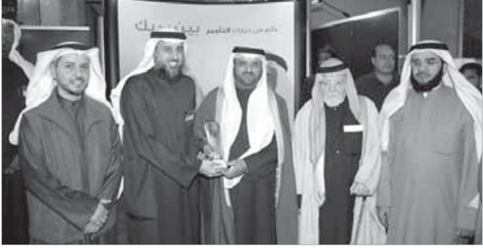
الوزير الهاجري يتسلم هدية تذكارية من «سبايك»

المهمة بالمنطقة، وتساهم في زيادة نموها وتطورها خاصة في ضوء تنامي الطلب بشكل كبير ومتزايد على المنتجات والخدمات المالية والإستثمارية المتوافقة مع أحكام الشريعة الإسلامية الغراء. وأشارت الشركة في بيانها إلى أن المؤتمر شكل فرصة مناسبة للتعريف بـ «سبايك» التي تنطهج لتكون لاعباً رئيسياً في المنطقة في صناعة الإجارة واستعرضت الشركة إنجازاتها خلال الفترة الماضية، كما استقبلت الكثير من