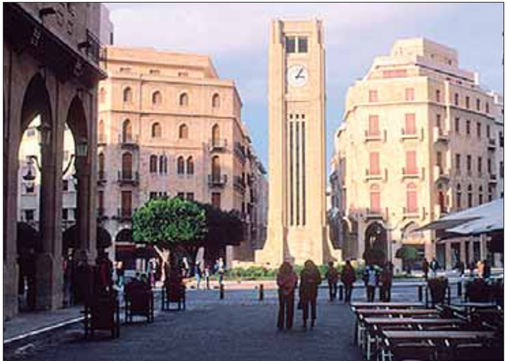
ساحة النجمة في بيروت