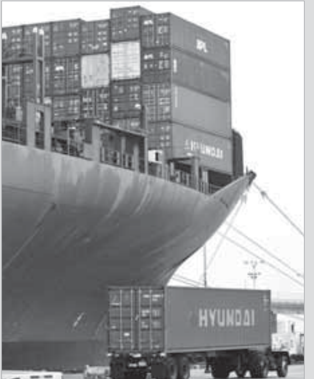
التبادل التجاري الخليجي في طريقه للتقدم بفضل السوق المشتركة

تحدثت مجلة الإيكونومست عن أبرز الأحداث التي تميزت بها منطقة الخليج خلال الشهور القليلة الماضية وقالت إن دول مجلس التعاون الخليجي الست شكلت السوق الخليجية المشتركة التي طال انتظارها حيث بات بإمكان مواطني الدول الأعضاء: المتعاون اقتصاديا متساوية في كامل منظومة دول مجلس التعاون الخليجي، بما في ذلك التعليم والرعاية الصحية والتوظيف.