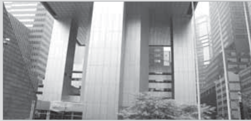
المقر الرئيسي لمجموعة سيتي جروب

مع تماسك هولدنج السنغافرية وديفيد سيلكتد أفابيزن الأميركية لإدارة الأموال لجمع 6.2 مليارات دولار مقابل إصدار أسهم عادية جديدة. كما دبرت ميريل 1.3 مليار دولار من بيع الجانب الأكبر من نشاطها لأقراض السوق المتوسطة إلى ذراع التمويل التجاري التابعة لشركة جنرال كرتريك. وتمثل الصفقة الأحدث حصّة تبلغ نحو 14٪ في ميريل لينش على أساس قيمتها السوقية الحالية وإصدار الأسهم الممتازة القابلة للتحويل الرأسميا بسعر يعاود توزيع تقدي سنوي قدره 9٪ وعلاوة تحويل تبلغ 17٪ على السعر المرجعي للسهم وهو 52.40 دولاراً. ويشمل المستثمرون الهيئة العامة للاستثمار الكويتية ومؤسسة الاستثمار الكورية وأحدى شركات مجموعات ميريلو المالية ثاني أكبر بنوك اليابان. وقال ثين في بيان «الصفقة تضمن تلقي ميريل لينش سيولة جيدة». وأضاف أنه يأمل أن يؤدي استثمار ميريلو إلى علاقات أعمق مع عملاء أثرياء في اليابان والصين. ومن بين المستثمرين الآخرين تي.بي.جي - آسبون كابيتال وبانر استثمار نيوجيرزي ومجموعة العليان وتي. راب برايس أسوشيتيس لصالح عدة عملاء. ويستحق العرض بعد عامين وتسعة أشهر. ويعكس السعر المرجعي البالغ 52.40 دولاراً متوسط سعر الإغلاق من 2007. في المقابل تجنبت كبرى البنوك في طوكيو الجانب الأسود من أزمة الائتمان فيما يرجع بالأساس إلى ضلّة استثماراتها في المنتجات ذات الصلة بالرهن العقاري عالية المخاطر. ولدى ميريلو نحو 7.4 مليارات دولار مستثمرة في منتجات ترتبط بأوراق مالية بضمنان رهون عقارية سكنية منها 982 مليون دولار مراكز في رهون عقارية عالية المخاطر. وكشف جون فين خليفة أونيل في رئاسة الشركة والمسؤول السابق لدى جولدمان ساكس والرئيس التنفيذي السابق لبورصة نيويورك للأوراق المالية يوروتكست في 24 ديسمبر الماضي عن اتفاق