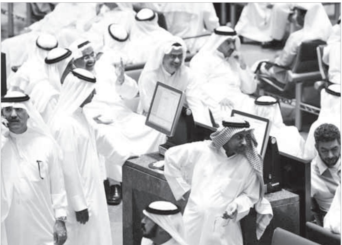
تداول متذبذب للبرصة خلال يوليو الماضي