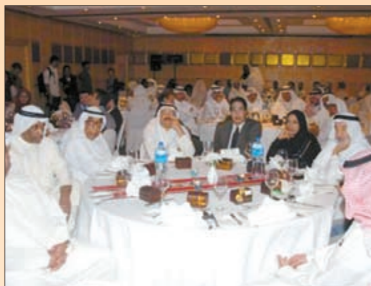
الفنان القدير منصور المنصور مع مجموعة من الضيوف في «ساس»