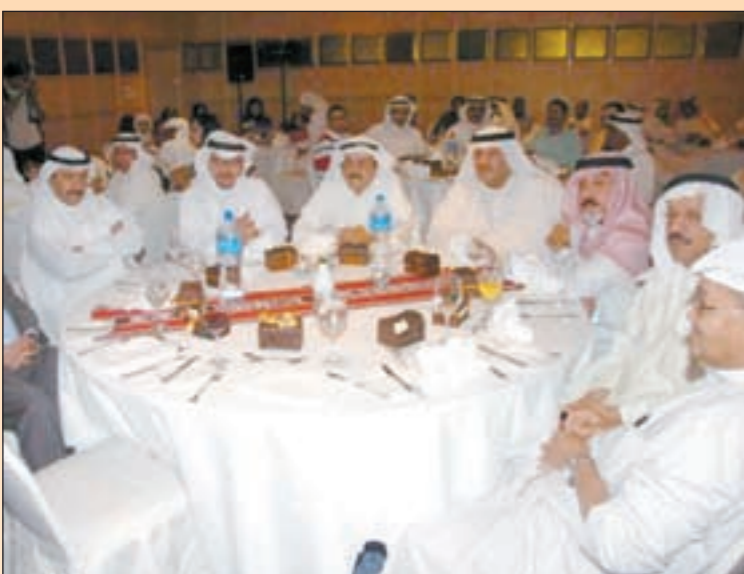
مئذ السريعة ونجف جمال في العيقة

بجرعات رومانسية دافئة ومنطقية ومشوقة، تضي أحداث الحلقات الأخيرة لـ «ساهر الليل» وتقرب من النهاية. المسلسل يمثل عملا متكاملًا بدءًا من