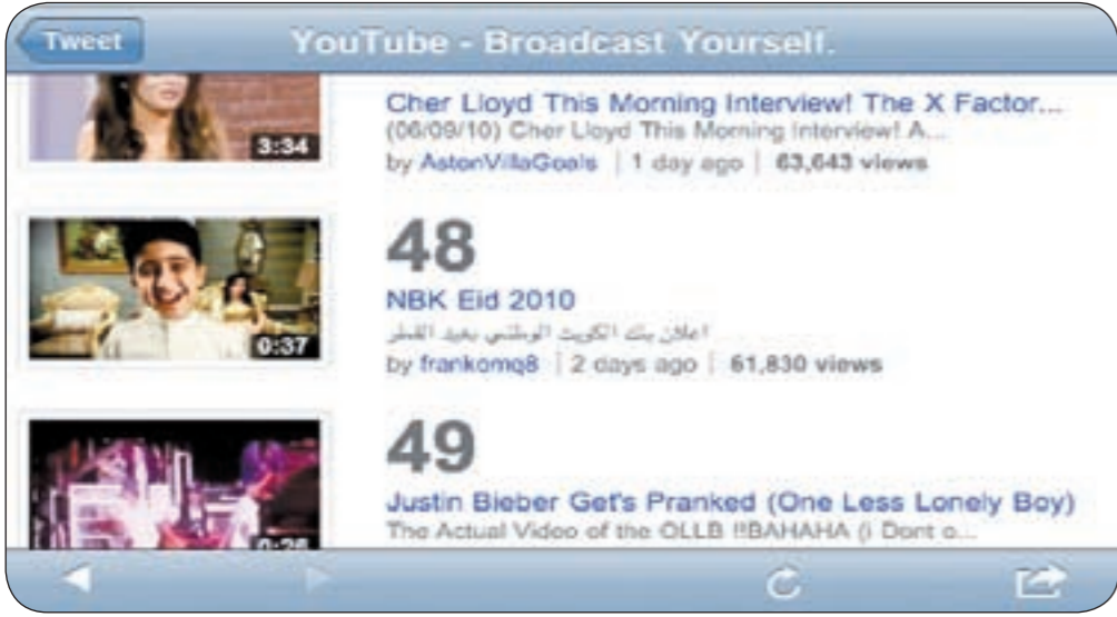
الإعلان على الـ «يوتيوب»

حظي إعلان بنك الكويت الوطني الجديد للعيد بنسبة مشاهدة كبيرة وغير مسبوقة في أوساط الجمهور ومشاهدي ومتصفحى المدونات ووسائل الإعلام الإلكترونية الفاعلة وذلك قبل عرضه على شاشات التلفزة المختلفة، حيث سجل هذا الإعلان، الذي أثار ضجة إعلانية واسعة في أوساط الجمهور بمختلف شرائحه وفتاته العمرية، أكثر من 100 ألف مشاهدة في اليوم الأول من طرحه عبر المدونات ومواقع التواصل الاجتماعي.