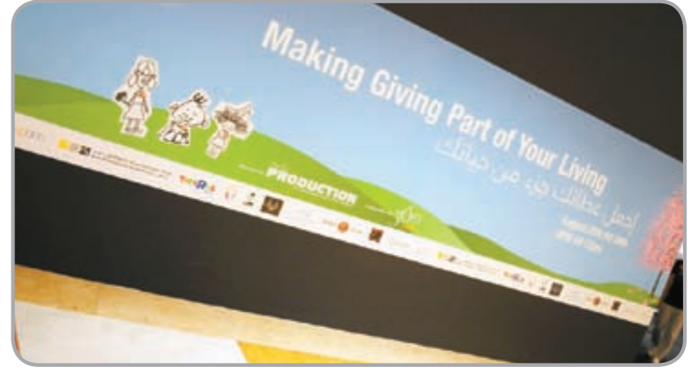
شعار الحملة الخيرية

وأضافت: «إن هذا النجاح غير المسبوق هو دليل آخر على تفرد بنك الكويت الوطني سواء على مستوى استيعاب ثقافة المجتمع وطريقة تفكير أفرادها أو على صعيد تبني واستخدام أحدث مبادئ وأساليب علم الاتصال والإعلام وتقنيات الإعلان».