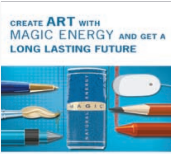
«ماجيك» مشروب الشباب

توليفة من المكونات الطبيعية الخالصة كالغوارانا التي تحفز طاقة الجسم، والجينسنغ الذي يحافظ على مستوى الطاقة لمدة أطول. ويساعد ماجيك الجسم على تعزيز نشاطه وتركيز حواسه والتوافق الحيوي بين الوظائف الحيوية للنشاط والتركيز. ماجيك هو مشروب طاقة سويدي تتم تعبئته في الكويت من قبل شركة السائر للمطبات.