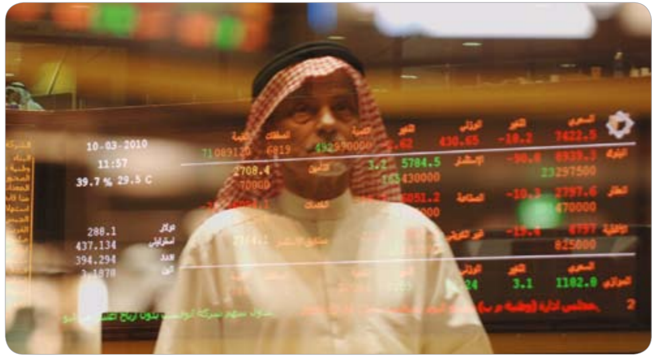
ترقب لانطلاقة قوية لمؤشرات السوق

واحتل قطاع الشركات الخدمية المركز الثالث بكمية تداول حجمها 85 مليون سهم نفذت من خلال 2231 صفقة قيمتها 18,7 مليون دينار. وجاء قطاع الشركات الصناعية في المركز الرابع بكمية تداول حجمها 38 مليون سهم نفذت من خلال 1184 صفقة قيمتها 11,2 مليون دينار. وجاء قطاع البنوك في المركز الخامس بكمية تداول حجمها 25,4